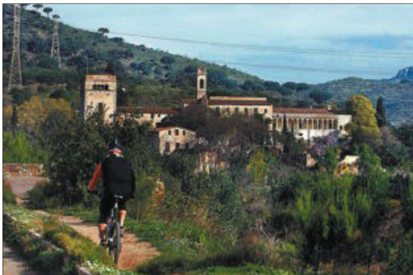
El monasterio de Sant Jeroni de la Murtra, en la sierra de la Marina.